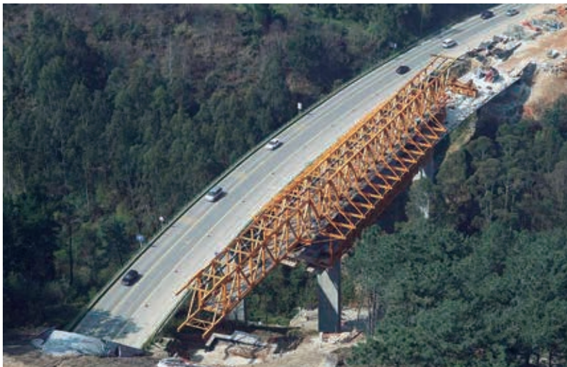
Figura 21. Cimbra C.A. para tres vanos

Para que el montaje de la cimbra C.A. no condicione el plazo y el coste de la obra los viaductos tendrán más de 7 u 8 vanos o bien un doble tablero que permita a la cimbra C.A. trasladarse de uno a otro con un número mínimo de operaciones. La misma cimbra autolanzable puede utilizarse en diferentes viaductos de una misma obra si el traslado entre dichos puentes es factible.