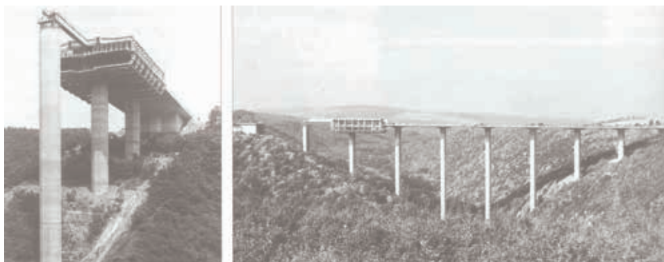
Figura 6. Viaducto de Elztal (Alemania) de Ulrich Finsterwalder 37,5 m de luz. Tablero tipo losa postesada de sección variable. 1966

En la década de los años 60 su uso pasó a ser generalizado, lo que propició que se incrementara la longitud de los vanos a ejecutar con la cimbra C.A.