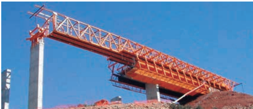
Figura 15. Viaducto Albentosa (Teruel) vanos de 50 m. 2005