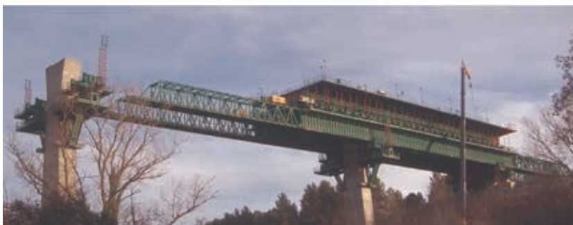
Figura 16. Viaductos LAV tramo Figueras – Frontera. Vanos de 60 m de luz