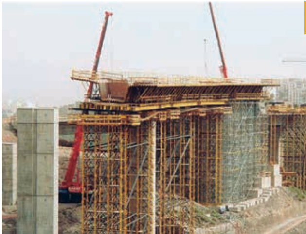
Figura 22. Secuencia de cimbra porticada y cimbra cuajada al suelo

La segunda diferencia fundamental es la capacidad de autolanzamiento de la cimbra C.A., que puede trasladarse de vano a vano por sus propios medios.