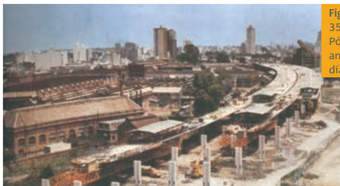
Figura 8. Autopistas Buenos Aires. Luces de 35 m. Cimbras de Röro. Frente de 4 cimbras. Pórticos de prefabricación de ferralla en vano anterior. Rendimiento de 90 m de tablero al día con 16 cimbras C.A. simultáneas. 1980

A partir de los años 70 el método comenzó a usarse en otros países.