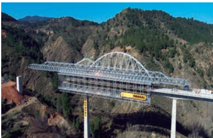
Figura 18. Puente sobre el Rio Cabriel, variante de Cofrentes. Vano 70 m. 2010