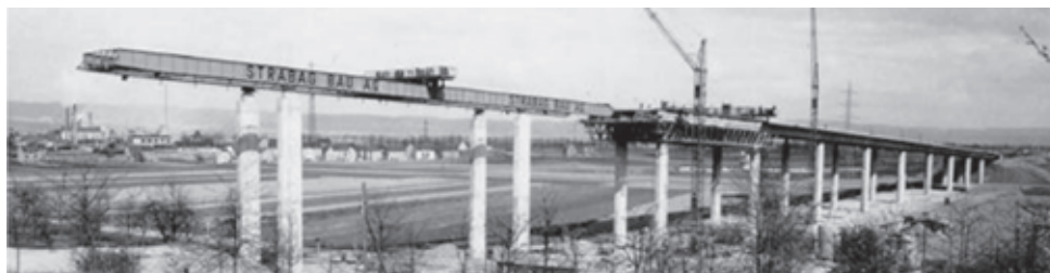
Figura 5. Kettiger Hangbrücke (Andernach) 13 vanos de 39,2 m de sección cajón de doble núcleo. Con cimbra autolanzable que desdoblaba la estructura de avance y la de encofrar cada vano. 1959

El Kettiger Hangbrücke fue construido en 1959 por la empresa Strabag con una cimbra C.A. compuesta por unas vigas en celosía destinadas soportar el encofrado y otras vigas de alma llena (separadas de las vigas anteriores) que tenían la función de viga de lanzamiento.