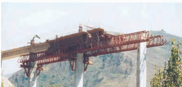
Figura 13. Viaductos en Piedrafita de la Autovía del Noroeste con vano de 46 m. 1999