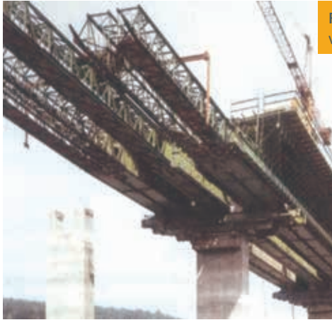
Figura 9. Viaducto de Blasbachtal de H. Wittfoht, vanos de 46,5 m

La primera aplicación en España se realiza en el año 1973. Desde entonces se han utilizado en nuestro país cimbras C.A. en multitud de ocasiones, primero con el plan de autovías del Plan General de carreteras de MOPU 1985-1991, e inmediatamente después con la construcción de líneas de alta velocidad, en las que se han empleado mayoritariamente cimbras C.A. para la realización de viaductos hiperestáticos con rango de luces de entre 45 m y 66 m.