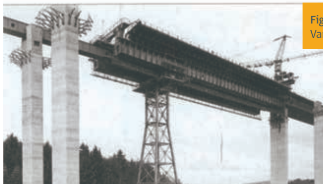
Figura 7. Döllbachtal Viaduct. De Hans Wittfoht. Vanos de 46 m luz. Vano de 70 m con apeo intermedio

A partir de los años 70 el método comenzó a usarse en otros países.