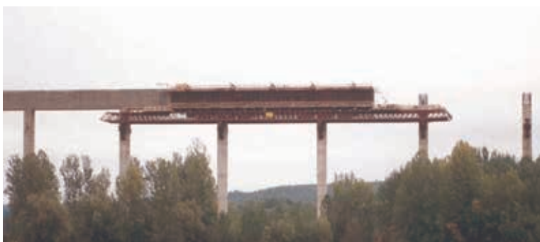
Figura 12. Canal alto de los Payuelos. 1992