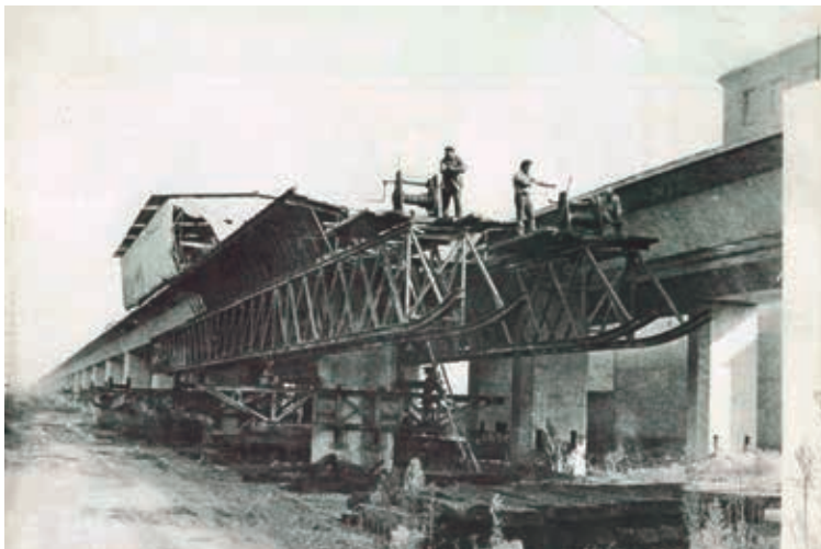
Figura 10. Supresión paso a nivel en Gerona (1973). Proyecto Carlos Fernández Casado, Contratista: UTE Dragados-Huarte. Cimbra C.A. Mecanotubo, luces de 20 m y ciclo de 6 días por vano

La primera aplicación en España se realiza en el año 1973. Desde entonces se han utilizado en nuestro país cimbras C.A. en multitud de ocasiones, primero con el plan de autovías del Plan General de carreteras de MOPU 1985-1991, e inmediatamente después con la construcción de líneas de alta velocidad, en las que se han empleado mayoritariamente cimbras C.A. para la realización de viaductos hiperestáticos con rango de luces de entre 45 m y 66 m.