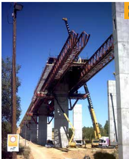
Figura 1. Cimbra autolanzable bajo tablero

Se define como cimbra aquella estructura que tiene como misión soportar a otra estructura provisionalmente durante su ejecución y que además es capaz de soportar su propio peso mientras el hormigón consigue resistencia suficiente, se introduce el pretensado, etcétera. Una cimbra autolanzable también tiene la capacidad de trasladarse de una posición inicial a la siguiente por sus propios medios. En adelante se utilizará el término cimbra C.A. para denominar a las cimbras autolanzables.