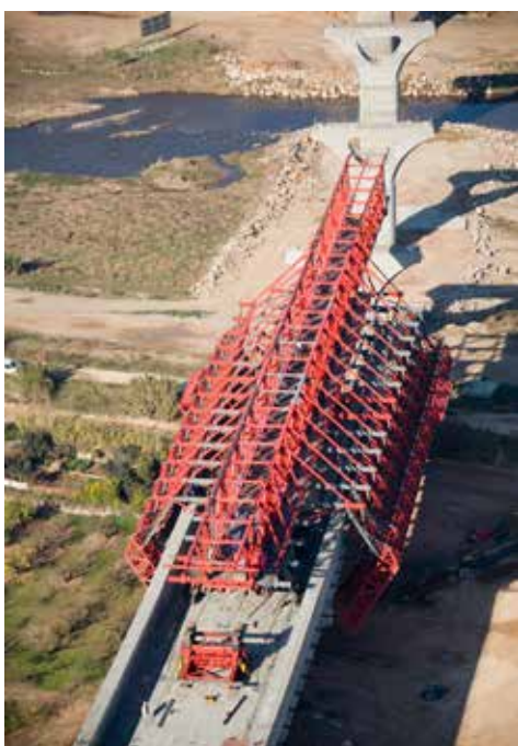
Figura 3. Cimbra C.A. sobre tablero