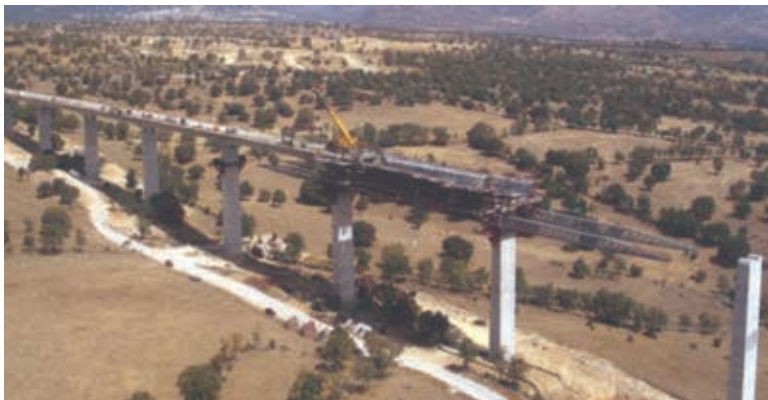
Figura 17. Viaducto de Arroyo del Valle. LAV al Noroeste. Vano 66 m. 2006