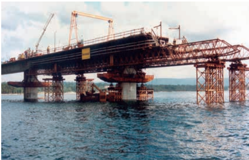
Figura 11. Puente a la Isla de Arosa (Pontevedra), 1.980 m de longitud con vanos de 50 m de luz. Construido mediante cimbra autolanzable con apoyo intermedio. 1984