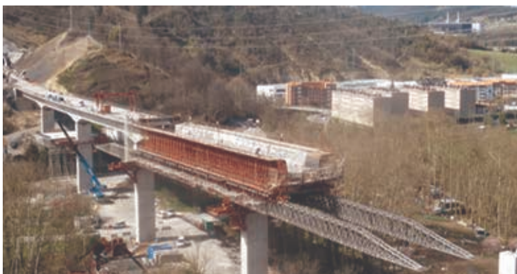
Figura 19. Viaducto de Ibaizabal. LAV Vitoria-Bilbao-San Sebastián. Vano 75 m. 2013