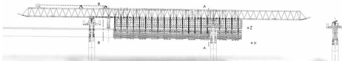
Figura 24. Cimbra C.A. sobre tablero

Existe una tipología variada en la configuración final de los distintos modelos de cimbras C.A. como sobre tablero, bajo tablero, etcétera, pero todas presentan una serie de elementos comunes.