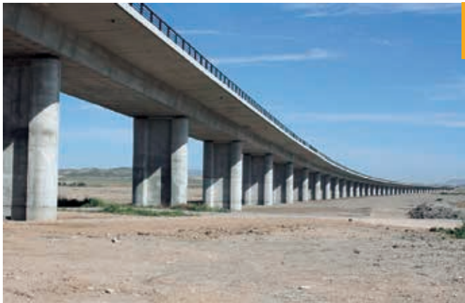
Figura 2. Las cimbras C.A. son especialmente adecuadas para puentes con muchos vanos

Así, en las páginas siguientes se abordarán aspectos relativos a la capacidad de movimiento de las cimbras C.A. teniendo en cuenta los riesgos y patologías inherentes a este sistema, las cuales no se dan en otras estructuras. Muchas de las recomendaciones aquí incluidas pueden hacerse extensivas a otras variedades de estructuras auxiliares móviles (como carros de avance y vigas lanzaderas).