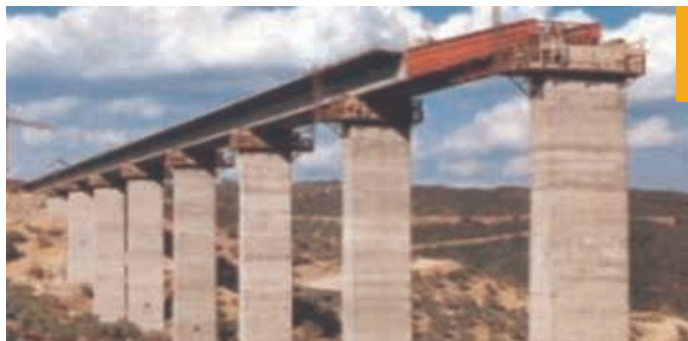
Figura 23. Puente ejecutado con el método del lanzamiento incremental o puente empujado

Otra diferencia importante entre ambos métodos se encuentra en el hecho de que el lanzamiento incremental solicita todas las secciones del tablero tanto a momentos positivos como negativos, y que dichos esfuerzos alcanzan valores que conllevan un canto mayor del tablero y una mayor cuantía de pretensado.