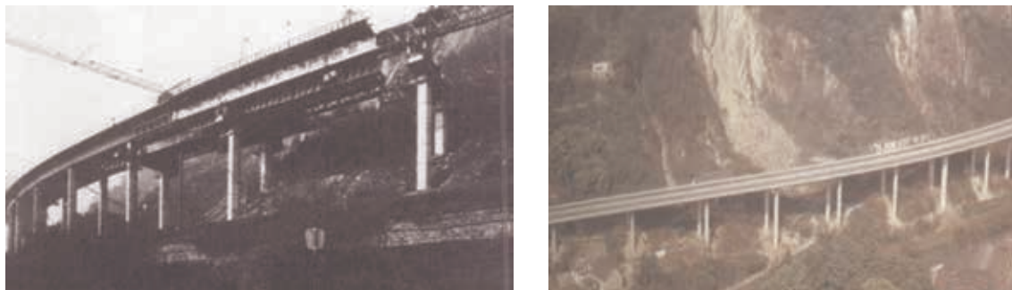
Figura 4. Krahnenberg Viaduct (Alemania), 1.100 m de viaducto con 34 vanos de 31,75 m. Hans Wittfoht. 1961

Las primeras realizaciones con cimbra C.A. se llevaron a cabo en Alemania a finales de la década de 1950.