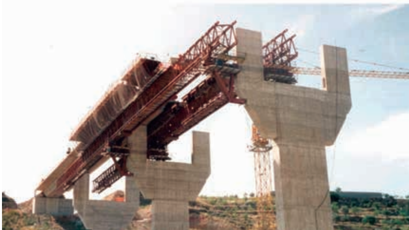
Figura 14. A-44 Alhendín- Durcal (Granada) con vanos de 53,5 m. 2000